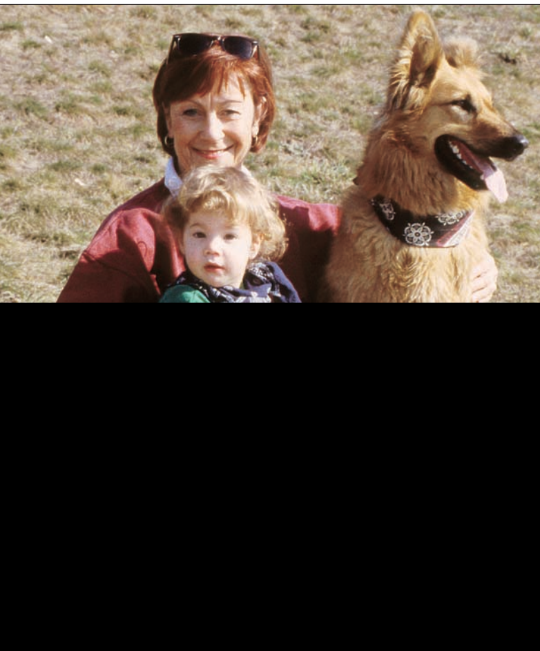
Psychologische Studien beweisen: Hunde in der Familie fördern die psychosoziale Entwicklung der Kinder.

Eine gute Hundeausbildung nach Methoden, die auf modernen wissenschaftlichen Erkenntnissen der Verhaltenskunde gründen (Motivation statt Starkzwang), ist Voraussetzung für ein problemloses Zusammenleben von Mensch und Hund. Die noch aus den Zeiten der Weltkriege stammende, und vor allem in manchen alten Gebrauchshundekreisen weiterhin explizit vertretene These, dass ein Hund erst „gebrochen“ werden müsse, damit er „pariere“, entbehrt jeder wissenschaftlichen Grundlage. Im Gegenteil, solche „gebrochenen“ Hunde sind außerhalb des direkten Einflussbereiches ihres „Abrichters“ überdurchschnittlich unsicher in ihrem Wesen und daher unberechenbarer, als Hunde mit einer motivationszentrierten Ausbildung. Unbestritten ist auch die Möglichkeit, einen Hund bewusst zu gesteigert aggressivem Verhalten auszubilden, was überwiegend in kriminellen Kreisen wahrgenommen wird. Man beachte da-